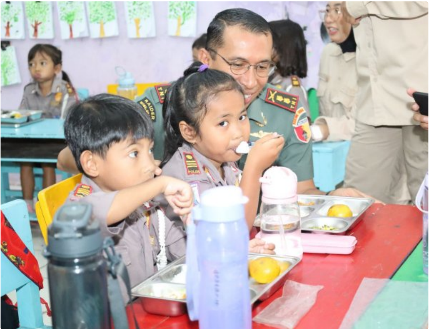
Dandim 0804/Magetan Bersama Forkopimda Dampingi Pemberian Uji Coba Makanan Bergizi Gratis